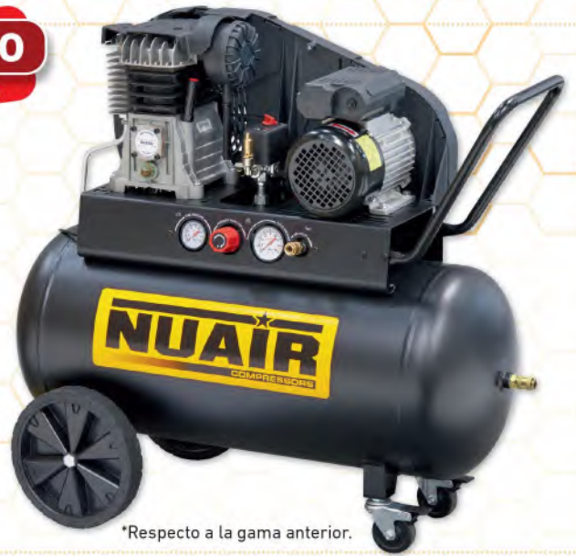
*Respecto a la gama anterior.