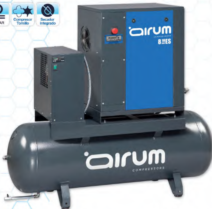
DBS 5.5-10-270 ES Airum

7.5 Hp caldera 270 lts. 650 lts./min. 400V III 10 bar. 64 dB(A)