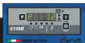
Controlador electrónico ETMII

Instalado sobre los modelos Compact de 10 hp y DBS hasta 15 hp.