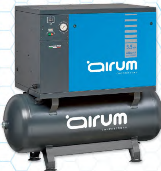
AIRSIL2 NB5/5.5FT/270 Airum

5.5 hp caldera 270 lts. 640 lts./min. 400V III 10 bar. 66 dB(A).