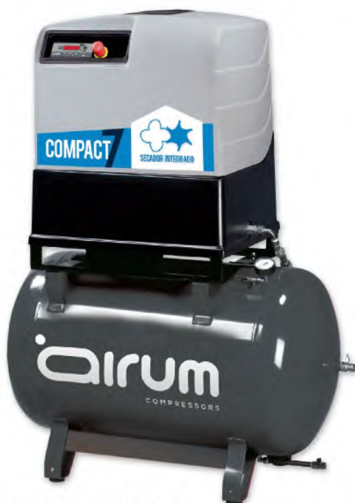
COMPACT 7-270 ES Airum

10 hp caldera 270 lts. 1000 lts./min. 400V III 10 bar. 67 dB(A)