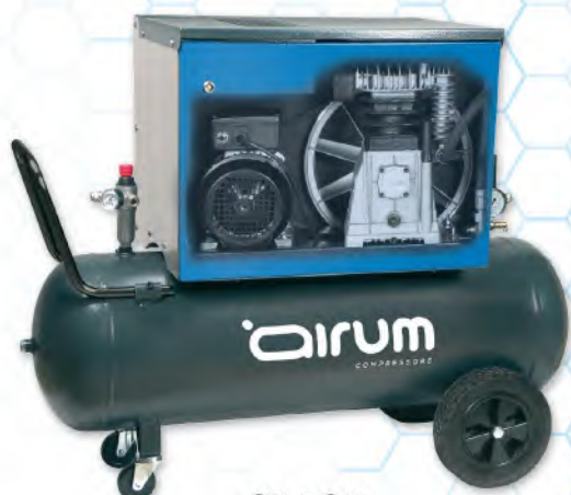
SILBOX B3800/100 CM3 Airum

3 hp caldera 100 lts. 390 lts./min. 230V II 10 bar. 69 dB(A).